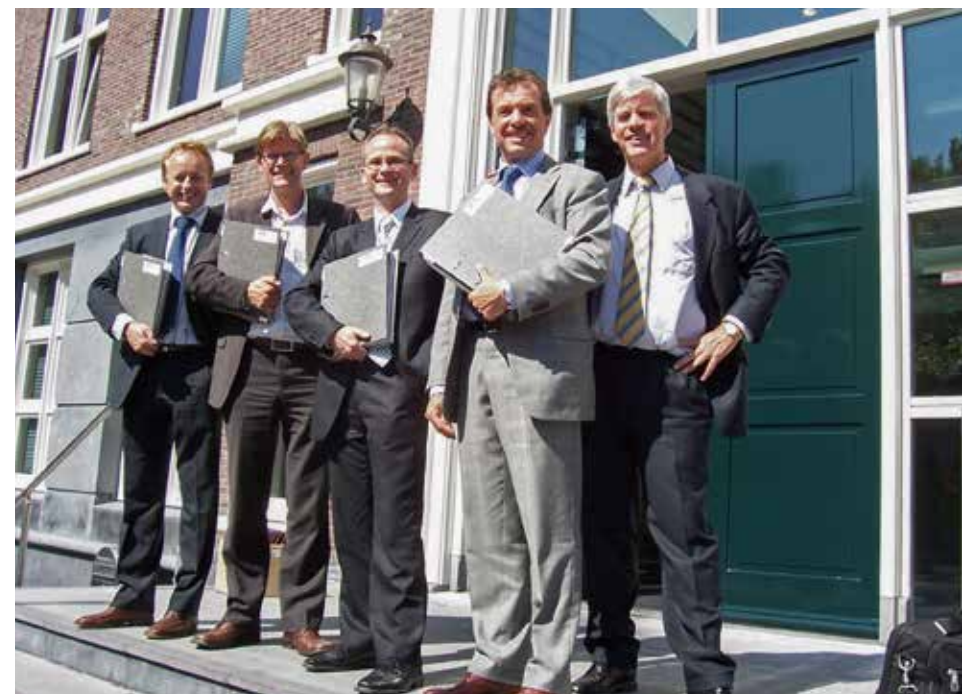
Ook voor de ambtelijke voorbereiders is het ondertekenen van de Samenwerkingsovereenkomst een mijlpaal (2006).

'De periode van 2010 tot en met 2016 noem ik de spektakeljaren van A2 Maastricht. Het project ontvouwde zich als een schouwspel om van te genieten. Ik heb me in deze periode beziggehouden met de afronding van de verwerving van de appartementen en