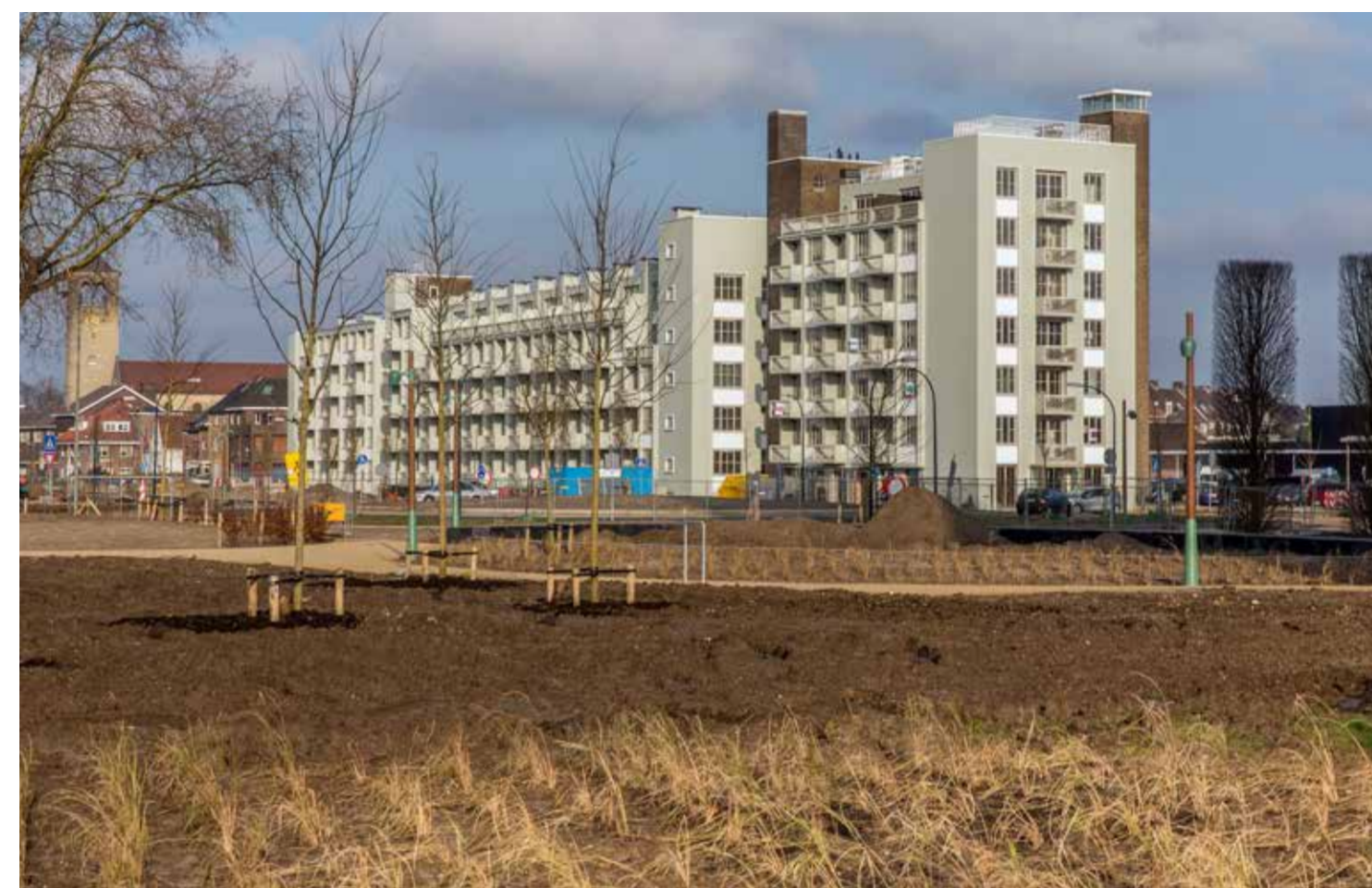
De reuzenpilaren bij de Voltastraat en Scharnerweg zijn iconische elementen, bedoeld om het gebied een eigen smoel en identiteit te geven (2017).